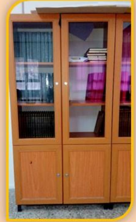
KUR'AN-I KERİM OKUMA ODAMIZ