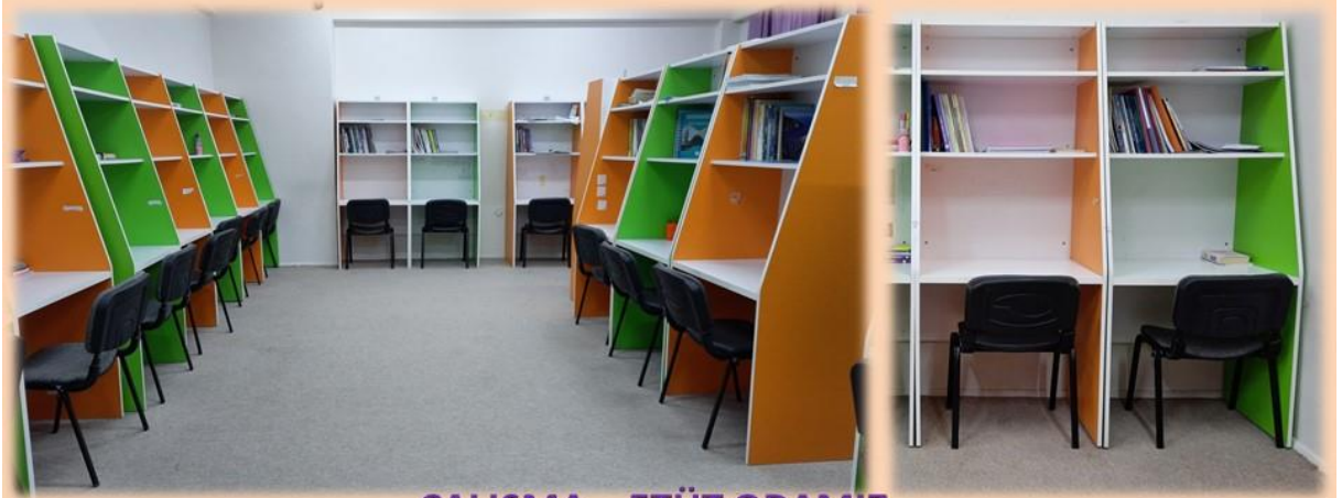
ÇALIŞMA – ETÜT ODAMIZ